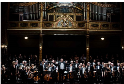
Iván Fischer